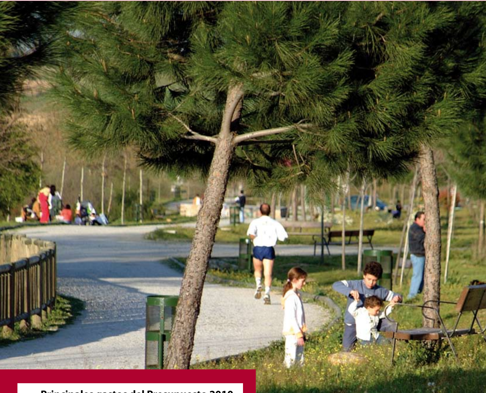
Principales gastos del Presupuesto 2010