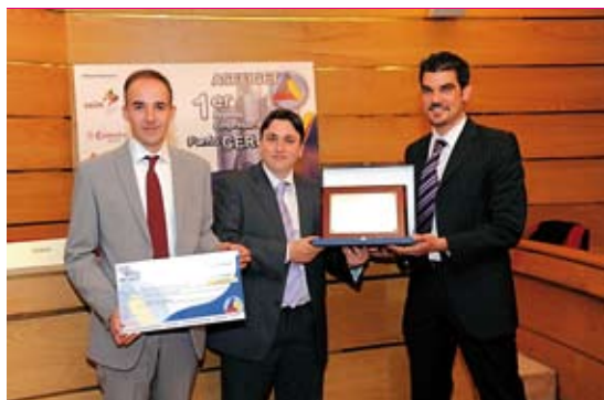
Los ganadores del premio para estimular a las nuevas empresas.

El Primer Premio Empresarial Punto Cero, organizado por la Asociación Española de Asesores Fiscales y Gestores Tributarios, ASEFIGET, lo obtuvo la empresa 'Solener Solar Renovables', de San Sebastián de los Reyes, radicada en el Centro Municipal de Empresas. Esta distinción fue creada por ASEFIGET